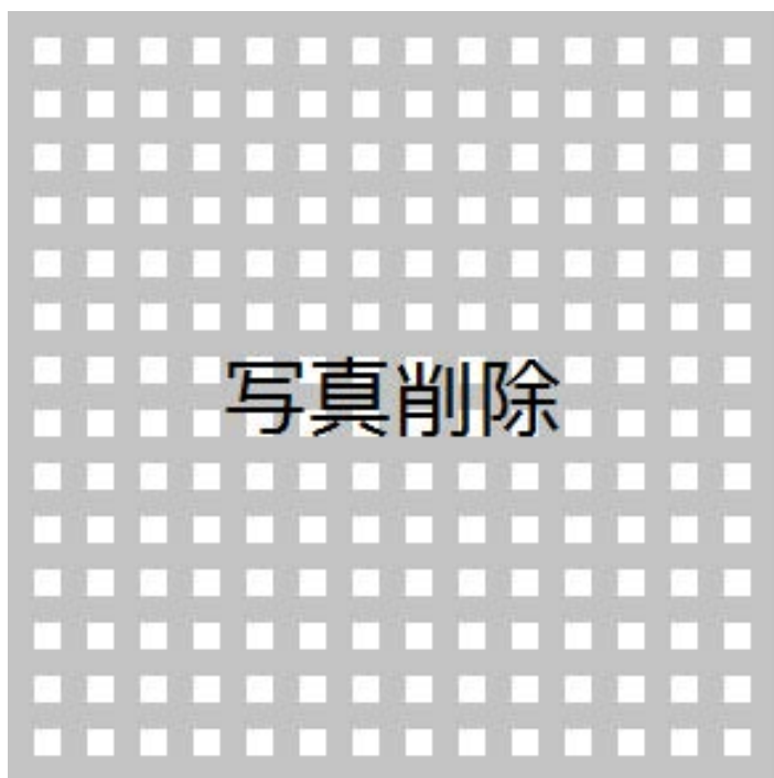
街頭風景 檳榔椰子の実を加工する女性